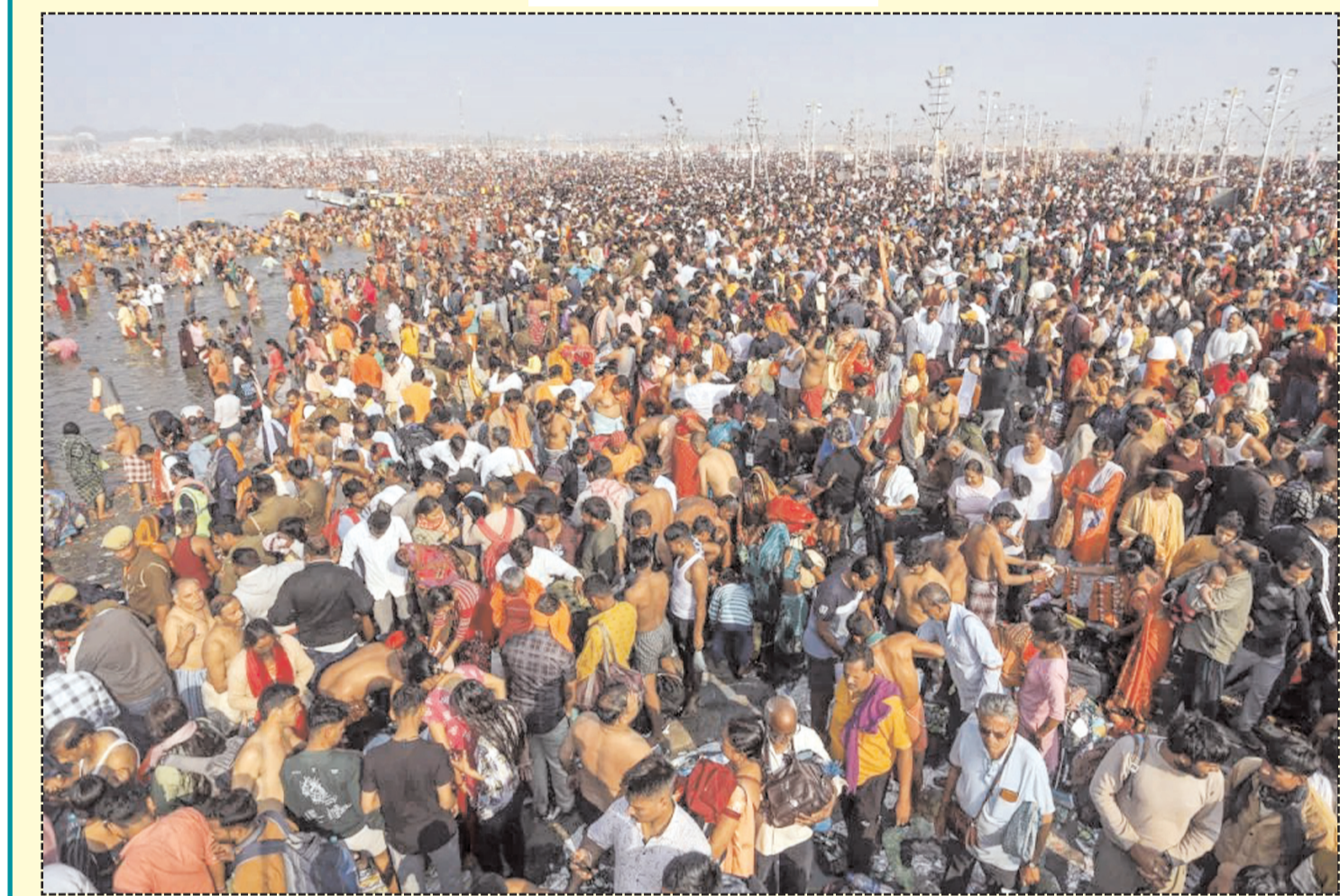
संगम तट पर आस्था का सैलाबए दिव्य स्नान का पुण्य लाभ लेने के लिए देश दुनिया के कोने कोने से श्रद्धालु तीर्थराज प्रयागराज पहुंचे।